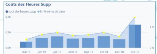
Suivi au mois le mois des indicateurs chiffrés

Pilotage social 5 axes d'analyse : Organisation Salarié (genre, tranche d'âge...) Type de contrat, statut Période (année, trimestre, mois)