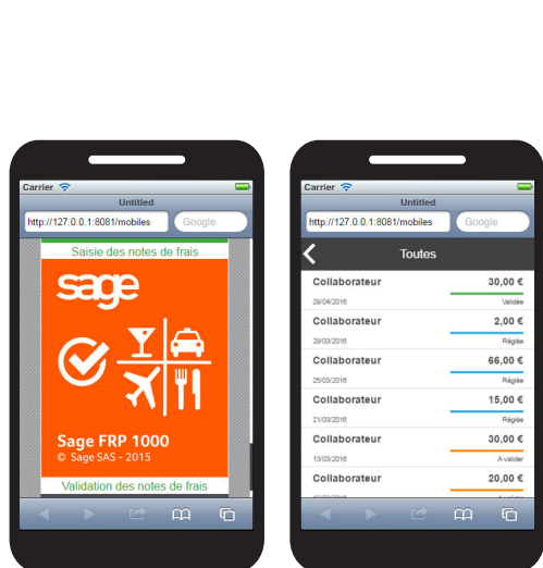
Sage FRP 1000 Notes de frais - Tableau de bord manager

bénéficie d'une plateforme technologique moderne et d'outils collaboratifs intégrés vous permettant un suivi des notes de frais en toute transparence entre vos collaborateurs, leurs managers et votre direction financière.